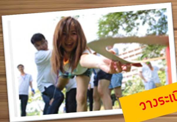
วาระเปิด