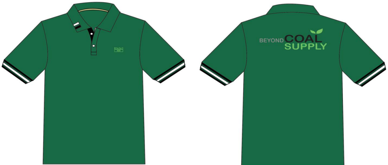
สีเขียวระดับพนักงาน

** แบบเสื้อจะเปลี่ยนแบบทุกๆ 2 ปี หรือแล้วแต่นโยบายบริษัท