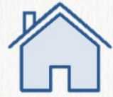
ประเภทมีหลักประกัน