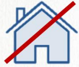
ประเภทไม่มีหลักประกัน